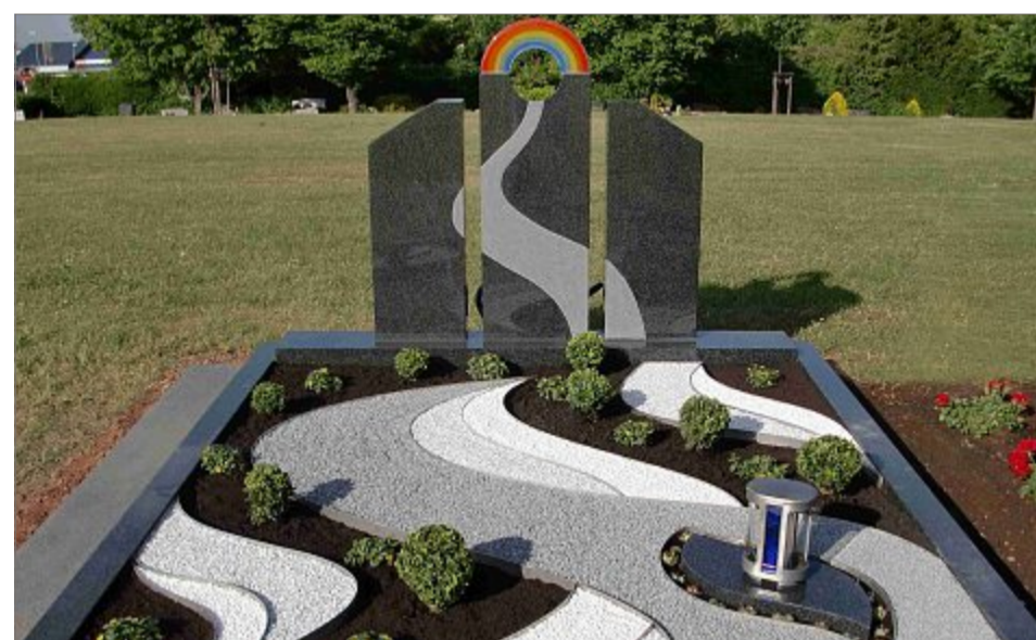
Verschlungene Lebenswege auf der Erde sind oft schön und doch steinig zugleich. Nach dunkler Wegstrecke führt der Weg aufwärts in das himmlische Land hinter dem farbenfrohen Tor aus dem Regenbogen. Die Idee und der Entwurf für diese Gestaltung stammen von Uwe Werthebach.