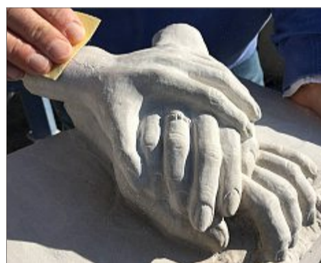
Bildhauerarbeiten können auf Fotowünsche hin realisiert werden. Auch diese Umsetzung gehört zum Repertoire des Fachunternehmens.