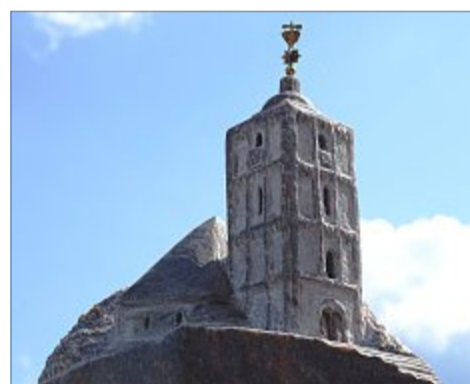
Ein Meisterstück aus der Bildhauerei der Familie Werthebach ist die nur 20 cm hohe in Stein gemeißelte Nikolaikirche mit dem vergoldeten Siegener Krönchen.