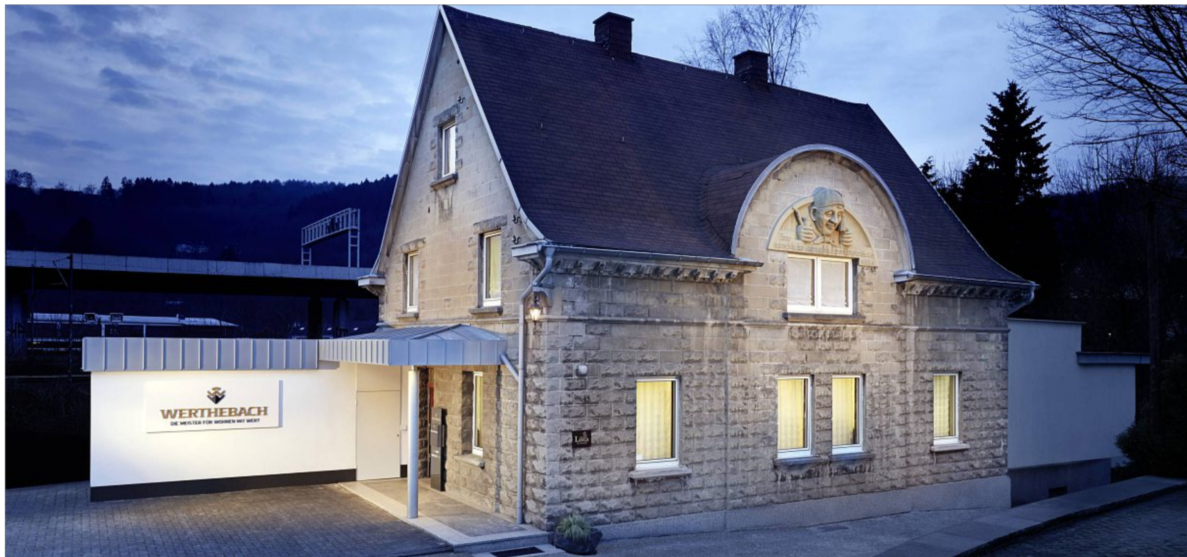
Das in seinem Baustil einzigartige historische „Meisterhaus“ ist Zeugnis der Kunstfertigkeit des Firmengründers. Die große Tonnengaube ziert ein aus Stein gemeißeltes Konterfei des deutschen Michels und kündigt in steinernen Lettern „Einer betracht's, der andere acht's, der dritte verlacht's, was macht's.“